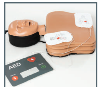
Platzierung der Defibrillations-elektroden