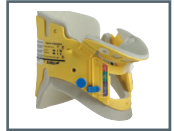
Ambu® Mini Perfit ACE®