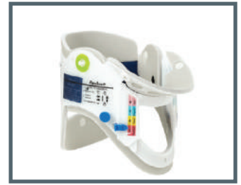
Ambu® Perfit ACE®