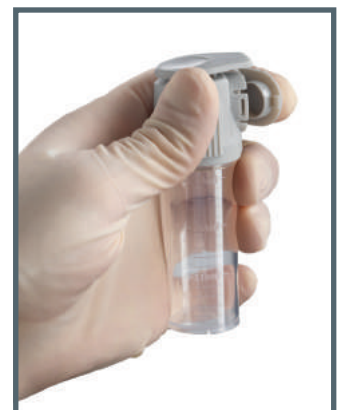
Leicht schliessender Deckel zur Versiegelung der entnommenen Probe

Klick-Sperrmechanismus („Flip Top“) zur Trennung des Anschlusses und zur Entfernung des Probenbehälters