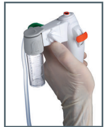
Wechsel von Absaugung zur Probenentnahme – ganz einfach per Schalterbetätigung